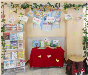
Выставка в Центральном доме культуры. 2016г.