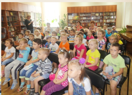
Юное поколение читателей. 2016г.