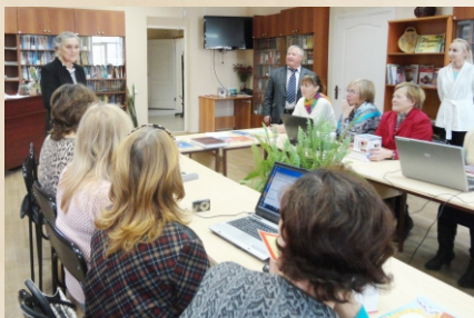
Районная олимпиада по информатике среди пенсионеров. 2015г.