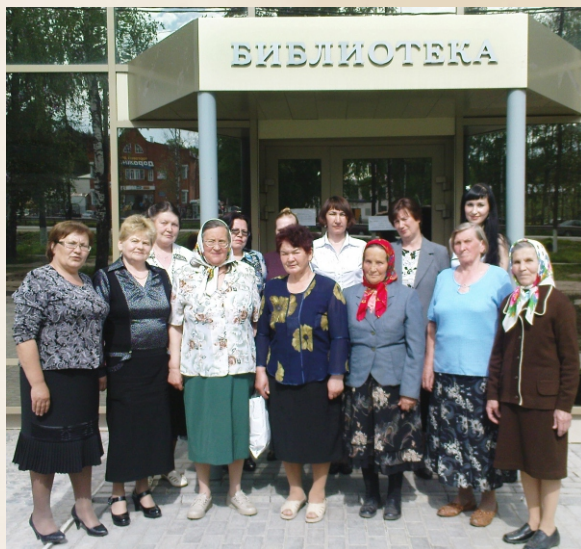
Встреча с ветеранами в библиотеке. 2012г.

Интеллектуальный ресурс МБУ «ЦБС» Чебоксарского района - это его специалисты. Пользователей обслуживают 58 библиотечных работников (37 из них имеют высшее, 18 – среднее профессиональное образование). Именно они определяют для своих читателей литературные пристрастия и увлечения, развивают лучшие библиотечные традиции и занимаются поиском современных методов работы.