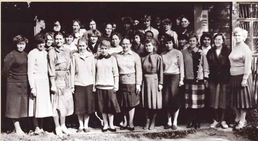
Коллектив библиотечкарей Чебоксарского района. 1990 г.