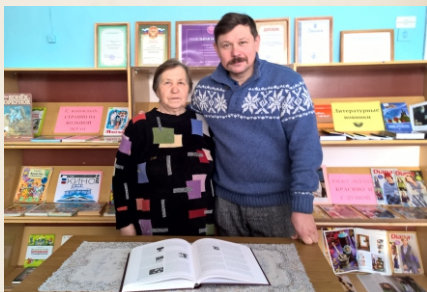
Известный российский актер А. Гуцин в Тренькасинской сельской библиотеке. 2016г.