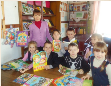
В Сятра-Лапсарской сельской библиотеке. 2016г.

К услугам читателей – полнотекстовые базы данных документов местного самоуправления, база данных правовой справочной системы «КонсультантПлюс», электронная библиотека «ЛитРес», межбиблиотечный абонемент и электронная доставка документов. Библиотеки района проводят большую работу по духовно-нравственному, патриотическому воспитанию молодежи, экологическому просвещению населения, популяризации чтения.