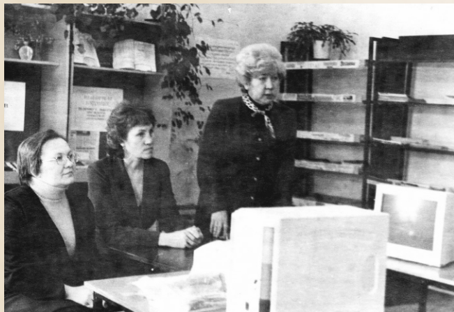
Министр культуры Чувашии Денисова О.Г. вручает Центральной библиотеке первый компьютер. 2002г.

С 2000 года библиотеки Чебоксарской районной ЦБС включились в мегапроект «Пушкинская библиотека». Фонды библиотек пополнились прекрасными изданиями по искусству, мировой культуре, учебными изданиями по экономике, праву, истории.