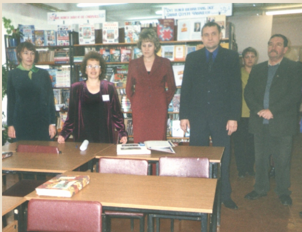
Открытие первой модельной библиотеки в д. Пархикасы. 2003г.

го района. На сегодняшний день доля библиотечного фонда, отраженного в электронном каталоге, составляет 100%. Район первым среди ЦБС республики достиг этой цифры. Постепенно библиотеки стали превращаться в новые информационные учреждения. Реализуя Указ Президента Чувашской Республики Н.В. Федорова «О создании сельских модельных библиотек в Чувашской Республике», 24 октября 2004 года в Чебоксарском районе открылась первая модельная библиотека. Ею стала Пархикасинская сельская библиотека. В библиотеке