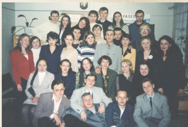
Члены молодежного спор-клуба «13-й дом» при Центральной библиотеке. 1998г.

Большое внимание в библиотеках уделялось организации досуга молодежи. В Центральной библиотеке начинает работать клуб для молодежи «13-й дом», деятельность которого в последующие годы стала известна на всю республику. В клубе проводились вечера, посвященные творчеству поэтов и писателей, встречи с известными специалистами своего дела, спор-часы. Главной целью работы клуба стала организация досуга молодежи, приобщение к чтению и книге.