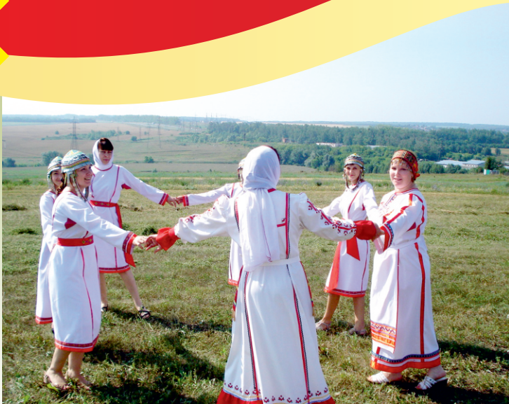
Библиотекари на съемках фильма о Чебоксарском районе. 2016г.