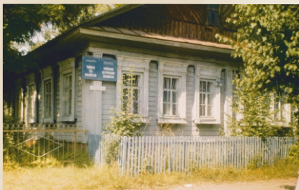
Центральная библиотека в 80-90-е годы 20 века по улице Советская, 13

Совета Министров ЧАССР «О переводе государственных массовых библиотек на централизованное обслуживание книгой». В состав ЦБС вошли районная библиотека, районная детская библиотека и 37 сельских библиотек. Это был очень интересный и насыщенный период в жизни библиотек. Проводилась большая работа по приведению книжных фондов и каталогов в соответствии с задачами централизации массовых библиотек. Фонд комплектовался целенаправленно по тематическим планам. Централизованная обработка литературы позволила создать на достаточно квалифицированном уровне минимум каталогов во всех библиотеках системы и достаточно