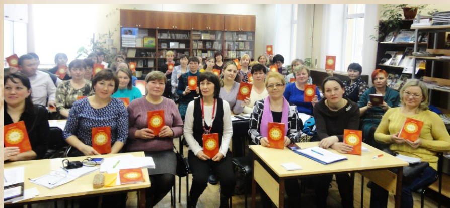
Чувашская писательница Ордем Гали на встрече с библиотекарями. 2016г.