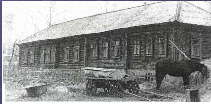
В подвальном помещении амбулатории ЦРБ находилась баклаборатория