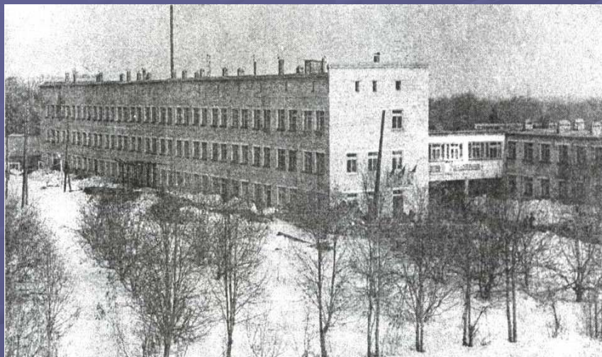
19 марта 1977 г. открыли главный корпус Центральной районной больницы

Постепенно организация отдела расширялась: 9 июня сформировалась гигиеническая секция, 12 сентября фармацевтический подотдел и комиссия по борьбе с венерическими болезнями. В состав отдела входят: член исполкома в качестве заведующего общим отделом, санитарный врач в качестве заведующего медико – санитарным подотделом, один из местных врачей, фармацевт в качестве заведующего фармацевтическим подотделом и школьный врач в качестве заведующего школьно- санитарным подотделом. В ведении отдела здравоохранения находятся 5 больниц, 3 приемных покоя и 1 фельдшерский пункт, 2 аптеки.