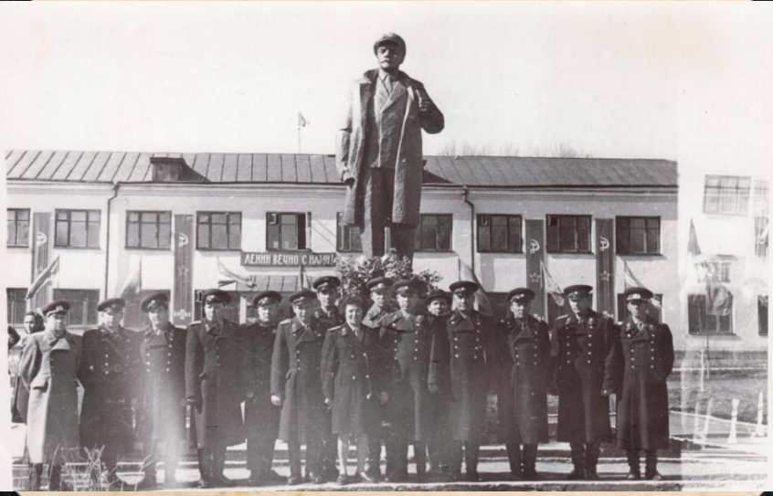
Первомайская демонстрация, б.г.