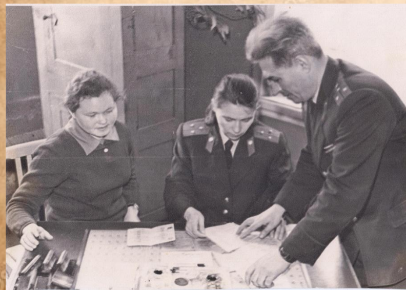
Вручение паспортов в Анат-Кинярской средней школы